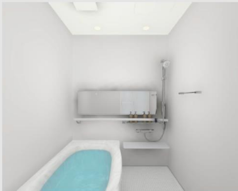
CG合成によるイメージ画像です。実物とは異なる場合があります。