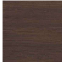
ソフトウォールナット柄