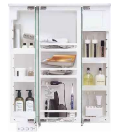
収納上部まで、たっぷり収納可能。(画像は幅750mm仕様)