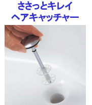
ささっとキレイヘアキャッチャー