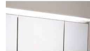
すっきりLED 従来より省エネでも、しっかり明るく照らします。