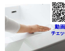
水アカをはじく素材だから汚れにくく、おそうじラクラク。衝撃に強く、割れにくい。