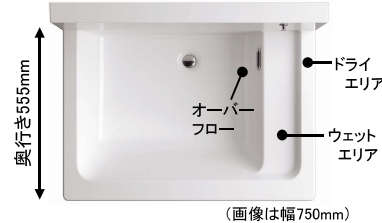
カウンターとボールの間に一段低いウェットエリアをご用意。底が濡れたコップや濡れたタオルもウェットエリアに気軽に置けます。●ボール深さ:180mm 容量:18L ※幅750mmとそれ以外のサイズでオーバーフローの位置が異なります。