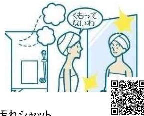
汚れシャット はっ水・はっ油に優れ、汚れをサッとふきとれる。お風呂上がりでも鏡がくもりにくい。