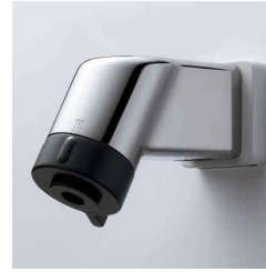
シャワーヘッド引出ありタイプ (カチット水栓)