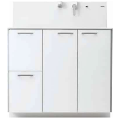
引出しタイプ (画像は幅900サイズ)