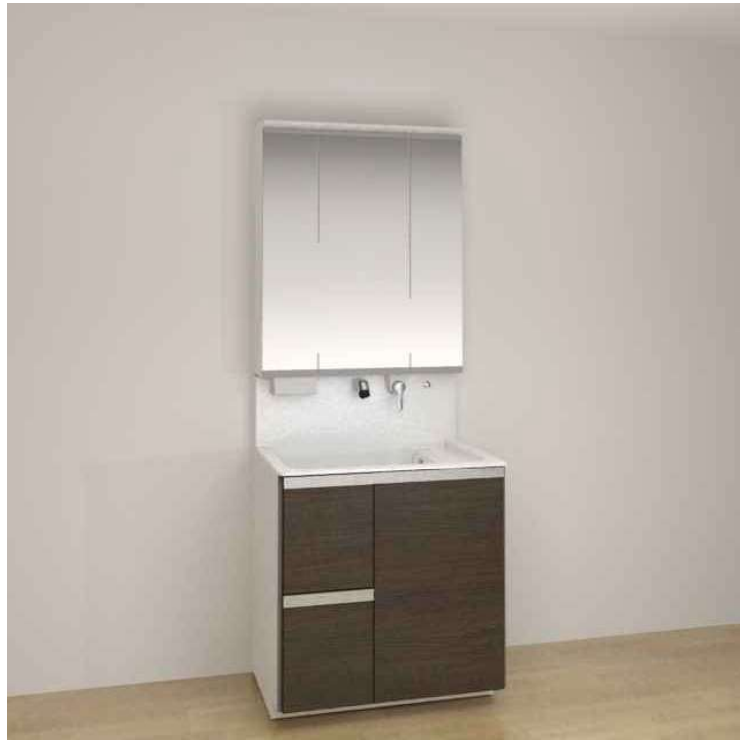
※画像はイメージです。組合せなどはお見積書をご確認ください。