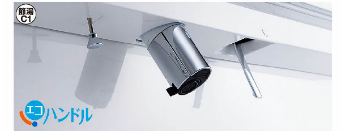
※写真は自動水栓タイプです。