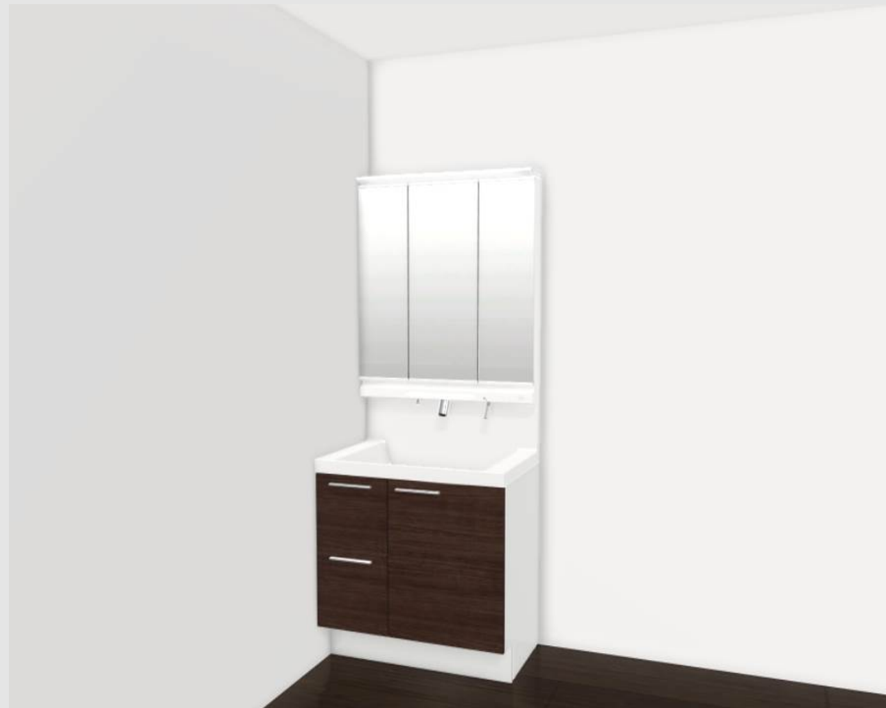
CG合成によるイメージ画像です。